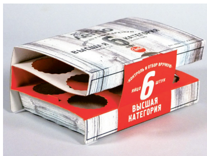
ОПАКОВКА ЗА ЯЙЦА „ЛЕТО“ ООО „Стора Энсо Пакаджинг ББ“ www.storaensopack.com.ru