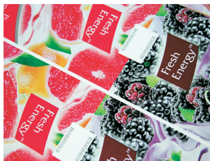
МНОГОСЛОЕН ЛАМИНИРАН ФИЛМ ЗА ОПАКОВКИ „ДОЙ-ПАК“ АО „ТИКО-Пластик“ www.tikoplastic.com