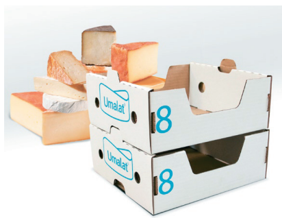
КУТИЯ ОТ ГОФРИРАН КАРТОН ЗА СИРЕНЕ ЗАО „ГОТЭК“ group@gotek.ru