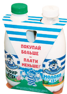
МУЛТИПАК ОПАКОВКА ЗА МЛЕЧНИ ПРОДУКТИ „ДАНОН“ АО „Смерфит Каппа Санкт-Петербург“ www.smurfitkappa.ru