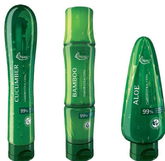
СЕРИЯ ОПАКОВКИ ЗА СЕРУМИ ТМ „ETU DE OR GANIX“ BLOOMART дизайн-студио www.bloomart.ru