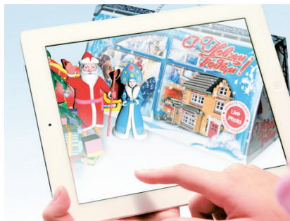
СЕРИЯ НОВОГОДИШНИ ОПАКОВКИ С ТЕХНОЛОГИЯТА ДОБАВЕНА РЕАЛНОСТ ЗАО „ГОТЭК-ПРИНТ“ www.gotek.ru