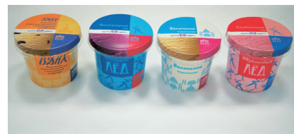
ОПАКОВКИ НА СЕРИЯ СЛАДОЛЕДИ „ВДНХ“ ЗАО „БРПИ“ (Баскин Роббинс) www.baskinrobbins.ru