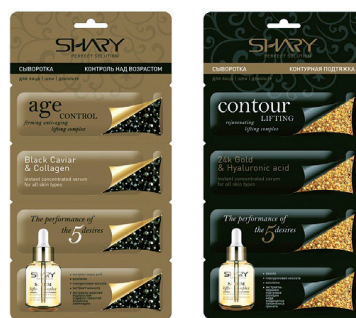
СЕРИЯ ОПАКОВКИ ЗА АЛГИНАТНИ МАСКИ ТМ „SHARY“ BLOOMART дизайн-студио www.bloomart.ru