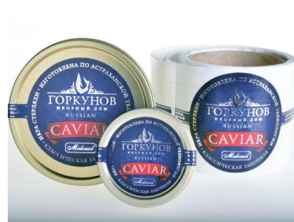
САМОЗАЛЕПВАЩ ЕТИКЕТ НА ОПАКОВКА ЗА ЧЕРЕН ХАЙВЕР ТМ „ИКОРНЫЙ ДОМ „ГОРКУНОВ“ ООО НПЦ НТ „Азимут“ www.azimutprint.ru