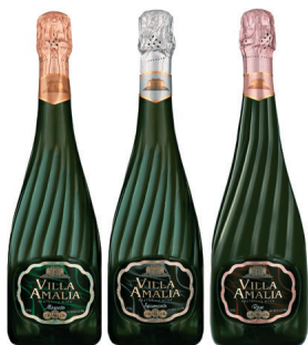
ОПАКОВКА ЗА ШАМПАНСКО „VILLA AMA LIA“ ООО „Комбинат шампанских вин“ www.vilashwine.com