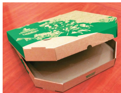
ОПАКОВКА ЗА ПИЦЦИ SFT Group www.sftgroup.ru