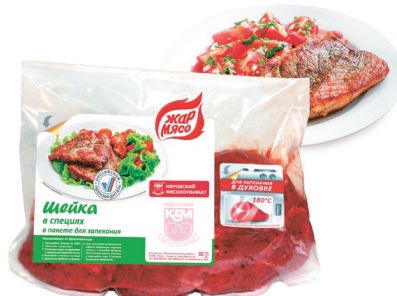
СЕРИЯ ЕТИКЕТИ ТМ „ЖАР МЯСО“ ООО „Вятка Флекс“ www.vtflex.ru