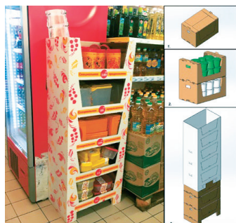
ШОУ-БОКС И МОДУЛНА СИСТЕМА ОТ ГОФРОКАРТОН ООО „Упаковочные решения“ upakresh@gmail.com