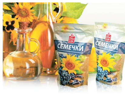
ОПАКОВКА ДОЙ-ПАК ЗА „СЕМЕЧКИ FINE LIFE“ ЗАО „Полінак“ www.gotek.ru

От 8 до 12 февруари т.г. в Москва се проведе 23-то издание на най-голямото за Русия и Източна Европа международно изложение на хранителни продукти, напитки и суровини за тяхното производство ПРОДЕКСПО 2016. Традиционно най-голям и тази година бе броят на изложителите от Русия и страните от бившата Руска федерация – Беларус, Армения, Казахстан и др. (1 424). Сред чуждите изложители (562 от 27 страни) имаше и участници от България, а най-сериозни бяха експозициите на участниците от Франция, Бразилия, Испания, Чили, Аржентина, Китай и Унгария.